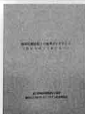
精神保健福祉士の倫理ガイドライン ～私たちはこうありたい～