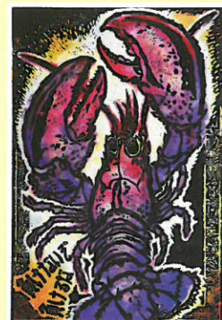
海の中のお話I(ロブスター)2015